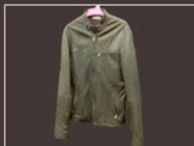
本革ジャケット 全体リフレッシュ