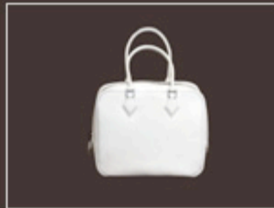
その他のラインナップ