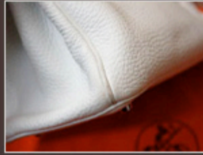
パーキン 4つかど修理