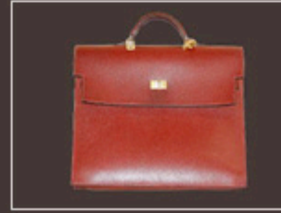
ケリー 全体リフレッシュ