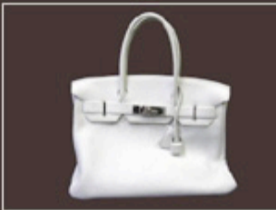
パーキン 全体リフレッシュ